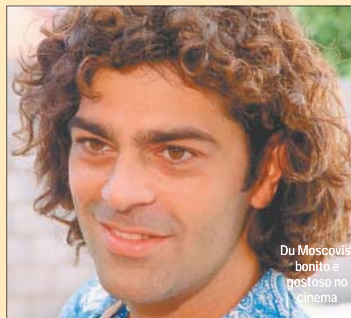
Du Moscovis, bonito e gostoso no cinema

"Fizemos cenas maravilhosas filmadas em belos cenários naturais de Salvador, Cachoeira e na Baía de Camamu. Este longa metragem é uma ode a Bahia. Leva a assinatura da Produtora Salles e com Walter Salles tudo vira profissionalismo, sucesso e respeito. O filme vai mostrar a Bahia das paixões arrebatadoras e dos sentimentos desenfreados".